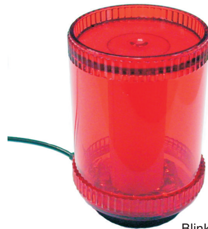
Blinkzylinder in Klebmontage

Die Gerätefamilie unserer Aktivanzeigen be- steht aus einer Vielzahl von Teillösungen und Anpassmöglichkeiten.